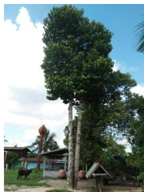
ภาพที่ ๕ ต้นยางนา

สมเด็จพระนางเจ้าสิริกิติ์ พระบรมราชินีนาถ ทรงปลูก ณ ศาลาประชาคม หมู่บ้านน้อมเกล้า อุทยานแห่งชาติภูสระดอกบัว ปลูกเมื่อ ๘ พฤศจิกายน ๒๕๓๘ ขนาดความโต นางที่ ๑ ความโต ๑๖.๔๐ นิ้ว ความสูง ๑๘ เมตร ทรงพุ่ม ๓.๒ เมตร นางที่ ๒ ความโต ๑๕.๙๐ นิ้ว ความสูง ๑๖ เมตร ทรงพุ่ม ๓ เมตร