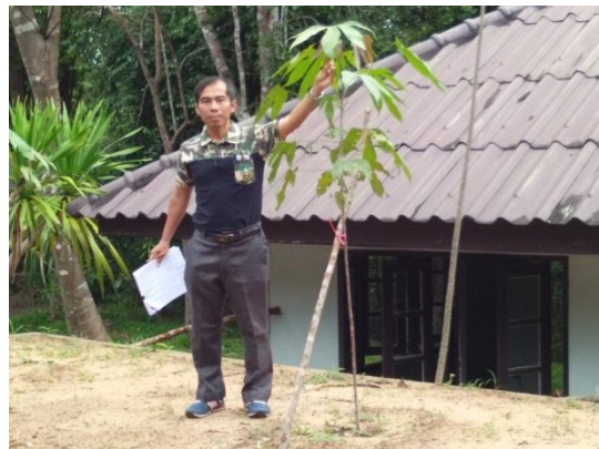
ภาพที่ ๓ ภาพต้นจอง

ผู้ดูแลรักษา : เจ้าหน้าที่อุทยานแห่งชาติภูจองนายอย โทร. ๐๔๕ ๒๑๐ ๗๐๖