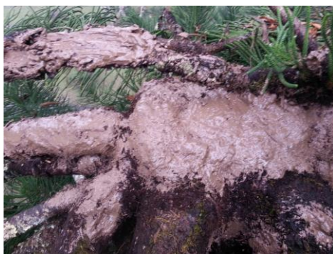
ภาพที่ ๖ ทาสารเมทาแลกซิลผสมกับสีพลาสติกป้องกันเชื้อราที่ยอดสนฉัตร