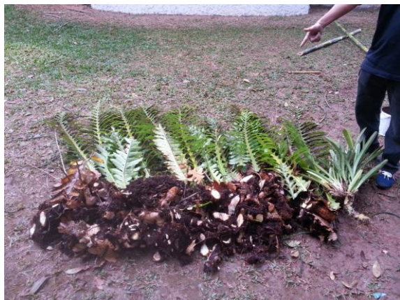
ภาพที่ ๔ ปริมาณกาฝากที่ขึ้นบนยอดต้นสนฉัตร