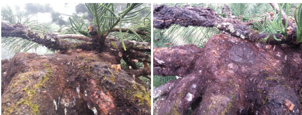
ภาพที่ ๕ ยอดต้นสนฉัตรหลังจากนำกาฝากออก