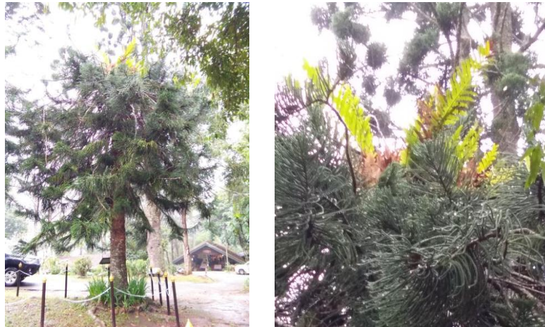
ภาพที่ ๒ กาฝากที่ขึ้นบนส่วนยอดของต้นสนฉัตร

เนื่องจากกาฝากขึ้นอยู่ที่ส่วนยอดของต้นสนฉัตร มีความสูง ๘ - ๙ เมตร จึงต้องใช้บันได ๒ อัน ผูกต่อกัน เพื่อให้ได้ความสูงถึงยอดต้นสนฉัตร