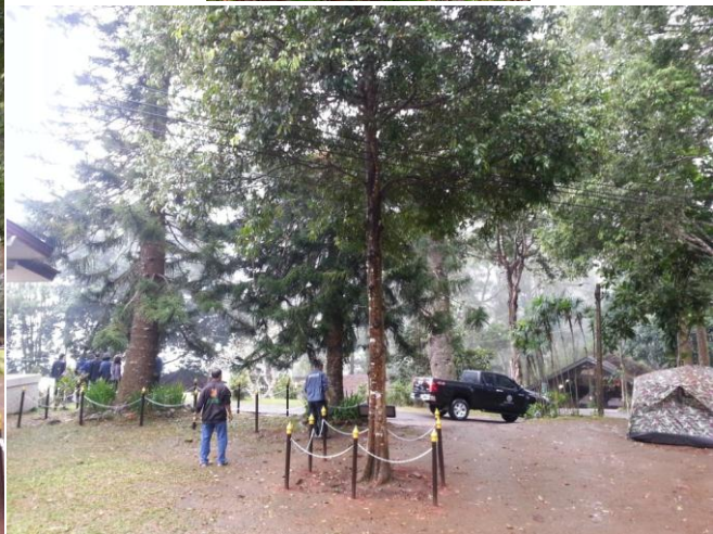
ภาพที่ ๑ ต้นสนฉัตร ที่พระบาทสมเด็จพระเจ้าอยู่หัวพระปรมินทรมหาภูมิพลอดุลยเดชฯ ทรงปลูกและภูมิทัศน์โดยรอบบริเวณที่ปลูก