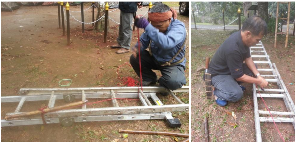
ภาพที่ ๒ การต่อบันได โดยใช้วิธีการใช้เชือกผูกต่อกัน

เนื่องจากกาฝากขึ้นอยู่ที่ส่วนยอดของต้นสนฉัตร มีความสูง ๘ - ๙ เมตร จึงต้องใช้บันได ๒ อัน ผูกต่อกัน เพื่อให้ได้ความสูงถึงยอดต้นสนฉัตร