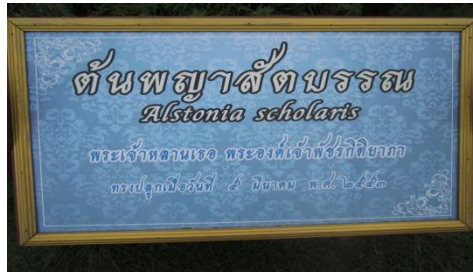
ภาพที่ ๒๕ ป้ายชื่อผู้ทรงปลูกและชื่อต้นไม้

๒.๒.๓ พระเจ้าหลานเธอ พระองค์เจ้าพัชรกิติยาภา ทรงปลูกต้นพญาสัตบรรณ จำนวน ๑ ต้น เมื่อวันที่ ๕ มิถุนายน ๒๕๕๓