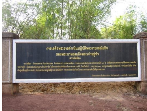
ภาพที่ ๙ ป้ายชื่อโครงการฯ

๑.๓ บริเวณโครงการพัฒนาพื้นที่ราบเชิงเขาป่าท่ากะบาก (๑) อันเนื่องมาจากพระราชดำริ บ้านคลองคันโท หมู่ที่ ๑ นองหมากฝ้าย อ.วัฒนานคร จ.สระแก้ว มีต้นไผ่สีสุกทรงปลูก จำนวน ๕ ก่อ เมื่อ วันที่ ๘ กรกฎาคม ๒๕๖๓