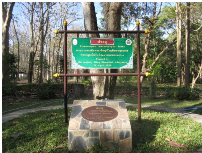
ภาพที่ ๓ ภาพป้ายชื่อและลำต้น