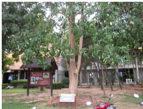
ภาพที่ ๓๑ ลำต้น