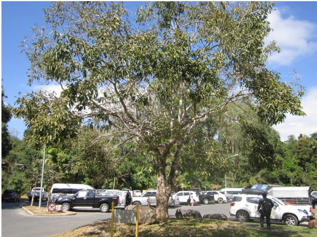
ภาพที่ ๘ ภูมิทัศน์รอบต้นหว้า

หมายเหตุ เจ้าหน้าที่ฝ่ายวิชาการ ได้ตรวจสอบสภาพต้นหว้าแล้วปรากฏว่า มีหนอนกินใบต้นหว้าทั้งต้นและทำรังที่ใบเป็นจำนวนมาก เห็นควรต้องใช้สารเคมีกำจัดในเวลาอันเหมาะสม (มีนักท่องเที่ยวจำนวนมาก) โดยด่วน ส่วนป้ายชื่อผู้ทรงปลูก ชื่อต้นไม้ รื้อรอบต้นไม้ จึงได้แนะนำให้จัดทำป้ายชื่อผู้ทรงปลูก ชื่อต้นไม้ รื้อรอบต้นไม้ และจัดภูมิทัศน์ให้สวยงามสมพระเกียรติ