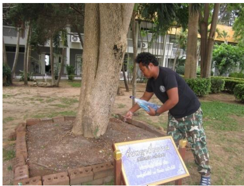
ภาพที่ ๓๒ เจ้าหน้าที่ใส่ปุ๋ยบำรุงดิน