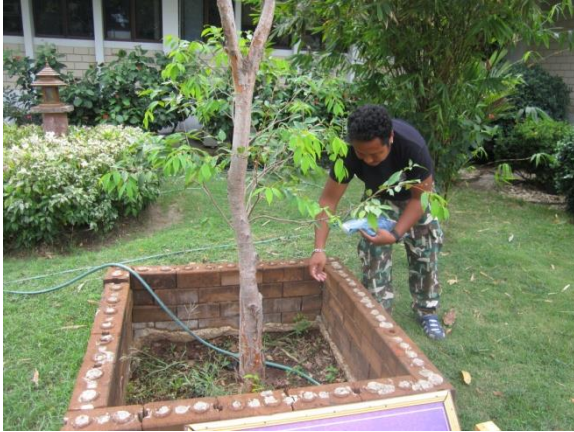
ภาพที่ ๒๐ เจ้าหน้าที่ใส่ปุ๋ยบำรุงดิน