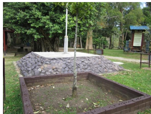
ภาพที่ ๑๗ ลำต้น