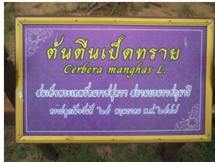
ภาพที่ ๒๒ ป้ายชื่อผู้ทรงปลูกและชื่อต้นไม้

๒.๒.๒ สมเด็จพระเทพรัตนราชสุดาฯ สยามบรมราชกุมารี ทรงปลูกต้นตีนเป็ดทราย จำนวน ๑ ต้น เมื่อวันที่ ๒๕ พฤษภาคม ๒๕๔๙