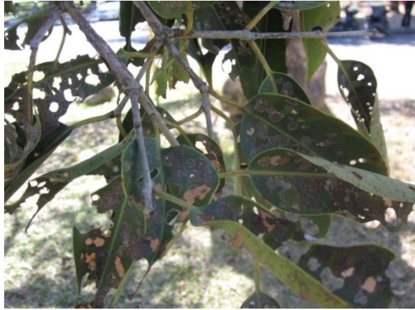
ภาพที่ ๗ หนอนกินใบต้นหว้าทั้งต้น