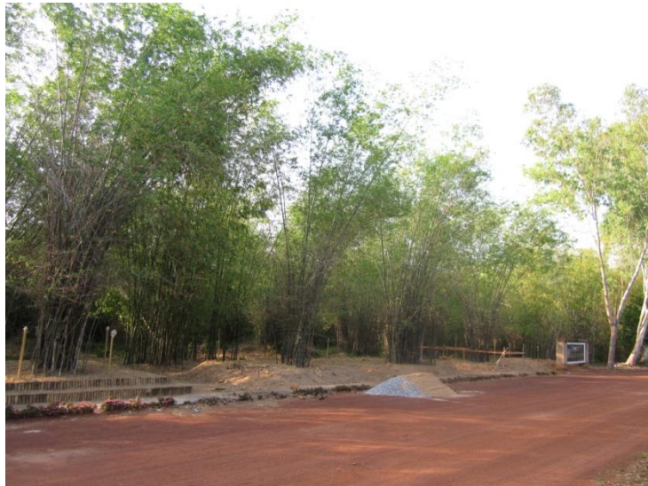
ภาพที่ ๑๐ แปลงไผ่สีสุก