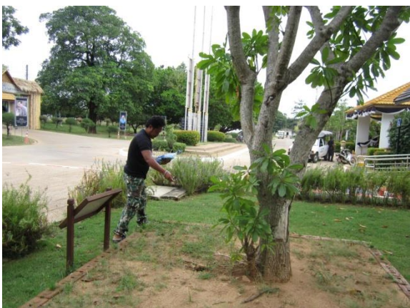
ภาพที่ ๒๓ เจ้าหน้าที่ใส่ปุ๋ยบำรุงดิน