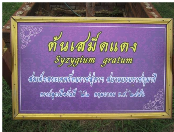
ภาพที่ ๑๙ ป้ายชื่อผู้ทรงปลูกและชื่อต้นไม้

๒.๒.๑ สมเด็จพระเทพรัตนราชสุดาฯ สยามบรมราชกุมารี ทรงปลูกต้นเสม็ดแดง จำนวน ๑ ต้น เมื่อวันที่ ๒๒ พฤษภาคม ๒๕๖๖