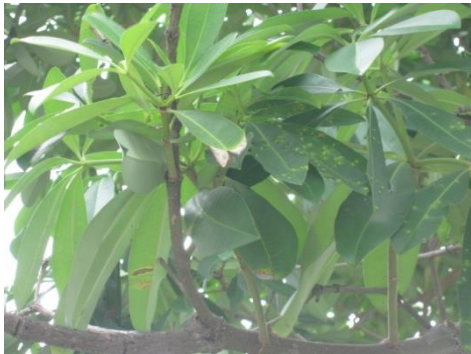
ภาพที่ ๒๖ ใบมีเพร็ลี้ยไก่อฟ้ากินใบ