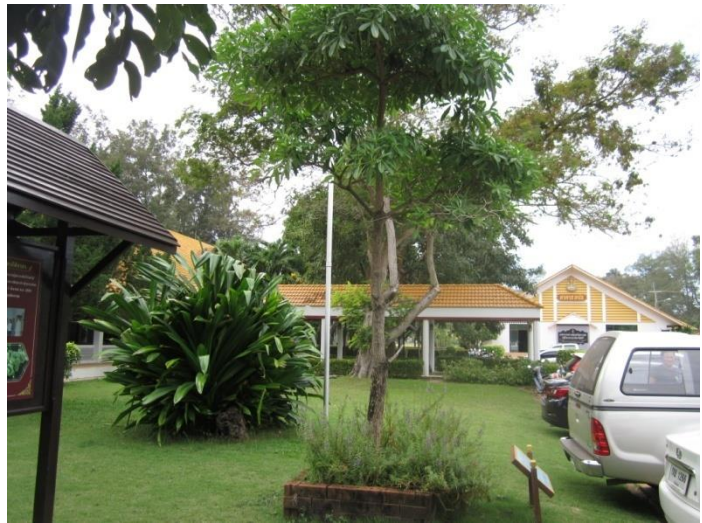
ภาพที่ ๒๗ ภูมิทัศน์รอบต้นพญาสัตบรรณ