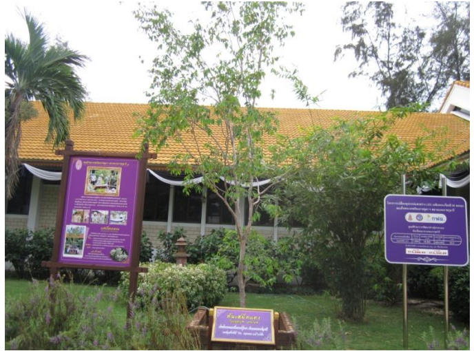
ภาพที่ ๒๑ ภูมิทัศน์รอบต้นเสม็ดแดง

๒.๒.๒ สมเด็จพระเทพรัตนราชสุดาฯ สยามบรมราชกุมารี ทรงปลูกต้นตีนเป็ดทราย จำนวน ๑ ต้น เมื่อวันที่ ๒๕ พฤษภาคม ๒๕๔๙