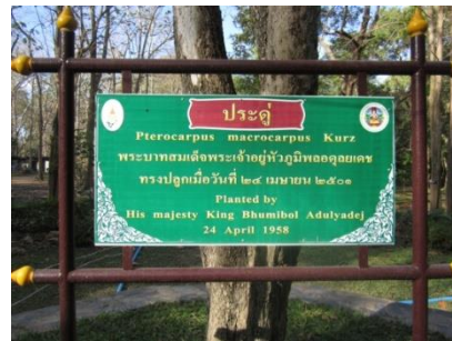
ภาพที่ ๒ ป้ายชื่อต้นไม้และผู้ทรงปลูก(ใหม่)