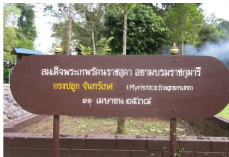
ภาพที่ ๑๕ ป้ายชื่อผู้ทรงปลูกและชื่อต้นไม้

๒.๑ ในความรับผิดชอบของเขตรักษาพันธุ์สัตว์ป่าเขาสอยดาว อำเภอสอยดาว จังหวัดจันทบุรี สมเด็จพระเทพรัตนราชสุดาฯ สยามบรมราชกุมารี ทรงปลูกต้นจันทร์เทศ จำนวน ๑ ต้น เมื่อวันที่ ๑๑ เมษายน ๒๕๓๘