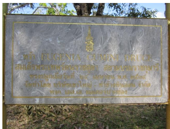
ภาพที่ ๕ ป้ายชื่อผู้ทรงปลูกและชื่อต้นไม้

๑.๒ ในความรับผิดชอบของอุทยานแห่งชาติเขาใหญ่ จังหวัดปราจีนบุรี สมเด็จพระเทพรัตนราชสุดาฯ สยามบรมราชกุมารี ทรงปลูกต้นหว้า จำนวน ๑ ต้น เมื่อวันที่ ๒๔ เมษายน พ.ศ.๒๕๓๔