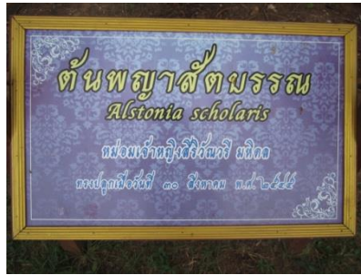
ภาพที่ ๒๙ ป้ายชื่อผู้ทรงปลูกและชื่อต้นไม้