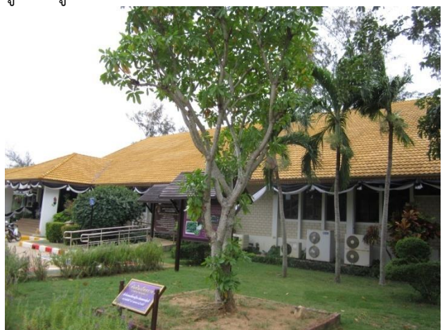
ภาพที่ ๒๔ ภูมิทัศน์รอบต้นตีนเป็ดทราย

หมายเหตุ เจ้าหน้าที่ฝ่ายวิชาการ ได้ตรวจสอบสภาพต้นตีนเป็ดทรายแล้วปรากฏว่า มีสภาพสมบูรณ์ตรวจไม่พบโรคแมลงศัตรูต้นไม้ สภาพดินขาดธาตุอาหาร จึงได้ใส่ปุ๋ยเพื่อบำรุงดิน