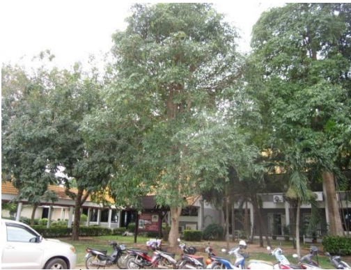
ภาพที่ ๓๓ ภูมิทัศน์รอบต้นพญาสัตบรรณ

หมายเหตุ เจ้าหน้าที่ฝ่ายวิชาการได้ตรวจสภาพต้นทรงปลูกแล้ว เห็นควรสั่งการให้เจ้าหน้าที่ฝ่ายปฏิบัติการอารักขาพันธุ์ไม้ป่า ไปดำเนินการดังนี้