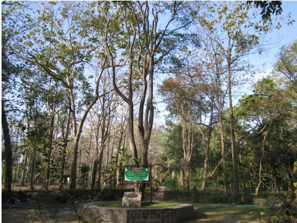
ภาพที่ ๔ ภูมิทัศน์รอบต้นประดู่

หมายเหตุ เจ้าหน้าที่ได้ตรวจสอบสภาพต้นประดู่ แล้วปรากฏว่าสมบูรณ์แข็งแรง ไม่พบโรคแมลงศัตรูต้นไม้ ส่วนป้ายชื่อผู้ทรงปลูกและชื่อต้นไม้ ยังไม่ถูกต้องตามแบบ รื้อรอบต้นไม้ไม่มี เจ้าหน้าที่ได้แนะนำให้ผู้ดูแลจัดทำป้ายชื่อผู้ทรงปลูกและชื่อต้นไม้ พร้อมทั้งรื้อรอบต้นไม้ให้ถูกต้องตามแบบแปลน และจัดภูมิทัศน์ให้สวยงามสมพระเกียรติ