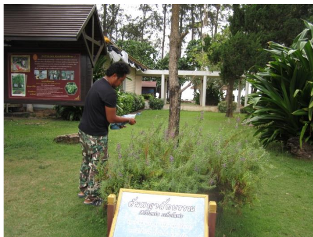
ภาพที่ ๒๘ ใส่ปุ๋ยบำรุงดิน

หมายเหตุ เจ้าหน้าที่ฝ่ายวิชาการ ได้ตรวจสอบสุขภาพต้นพญาสัตบรรณแล้วปรากฏว่า พบโรคเพร็ลี้ยไก่อฟ้าที่ใบและสภาพดินขาดธาตุอาหาร จึงได้ใส่ปุ๋ยเพื่อบำรุงดิน