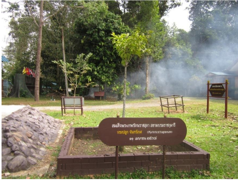
ภาพที่ ๑๘ ภูมิทัศน์รอบต้นจันทน์เทศ

หมายเหตุ เจ้าหน้าที่ตรวจสอบสภาพต้นจันทน์เทศแล้ว ปรากฏว่าทรงปลูกตั้งแต่ ๑๑ เมษายน ๒๕๖๘ มีอายุ ๒๑ ปี สภาพต้นไม่เจริญเติบโตแคระแกรน เจ้าหน้าที่สันนิษฐานว่า ตำแหน่งปลูกต้นไม้น่าจะมีน้ำใต้ดินหรืออาจมีหินขนาดใหญ่อยู่ใต้ตำแหน่งปลูก จึงได้แนะนำให้เจ้าหน้าที่ชุดล้อมขึ้นมาอนุบาลให้ต้นไม้แข็งแรง และย้ายตำแหน่งที่ปลูกใหม่ ให้เหมาะสม ส่วนป้ายชื่อผู้ทรงปลูกชื่อต้นไม้ รื้อรอบต้นไม้ ให้จัดทำใหม่ตามแบบแปลนและจัดภูมิทัศน์ให้สวยงาม สมพระเกียรติ