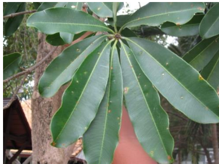
ภาพที่ ๓๐ ใบ