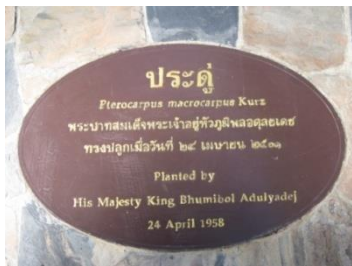
ภาพที่ ๑ ป้ายชื่อต้นไม้และผู้ทรงปลูก(เก่า)

๑.๑ ในความรับผิดชอบของสวนรุกขชาติมวกเหล็ก จังหวัดสระบุรี พระบาทสมเด็จพระปรมินทรมหาภูมิพลอดุลยเดช มหิตลาธิเบศรรามาธิบดี จักรีนฤพดินทร สยามินทราธิราช บรมนาถบพิตรมีต้นประดู่ ทรงปลูกต้นประดู่ จำนวน ๑ ต้น เมื่อวันที่ ๒๔ เมษายน ๒๕๖๐