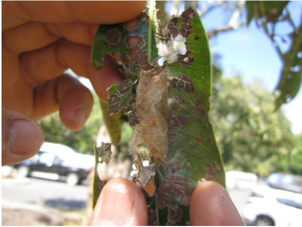
ภาพที่ ๖ หนอนทำรังที่ใบต้นหว้า