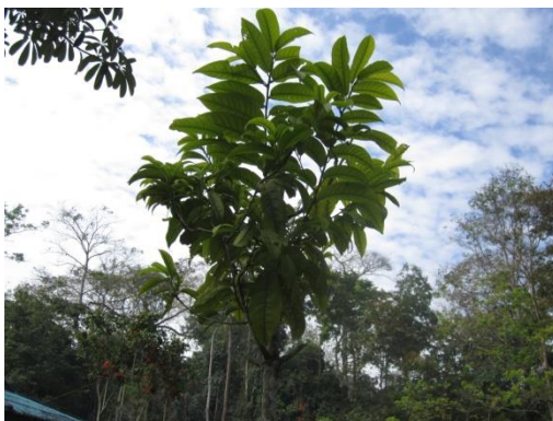
ภาพที่ ๑๖ ใบ