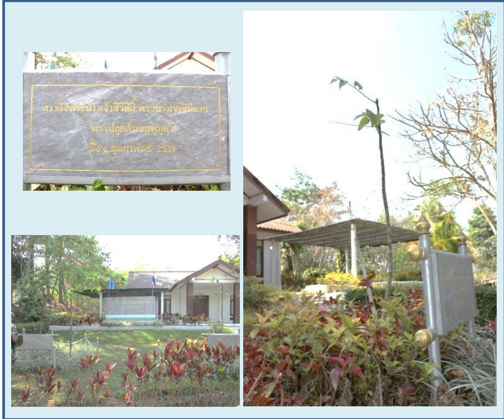
ภาพที่ ๑๐ ป้ายทรงปลูก ลำต้นและภูมิทัศน์ ต้นชมพูภูคา

สมเด็จพระนางเจ้าสิริกิติ์ พระบรมราชินีนาถ ทรงปลูก ณ บริเวณหน้าสำนักงานบ้านน้ำตวง อำเภอแม่จริม จังหวัดน่าน ปลูกเมื่อ ๖ กุมภาพันธ์ ๒๕๓๘ ขนาดความโต ๐.๙๓ ความสูง ๒ เมตร ทรงพุ่ม ๐.๕๐ เมตร ความสูงระดับน้ำทะเล ๗๘๓ เมตร