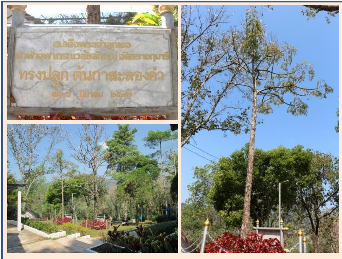
ภาพที่ ๑๒ ป้ายทรงปลูก ลำต้นและภูมิทัศน์ ต้นกาสะลองคำ

สมเด็จพระเจ้าลูกเธอ เจ้าฟ้าจุฬาภรณวลัยลักษณ์ อัครราชกุมารี ทรงปลูก ณ บริเวณหน้าสำนักงานบ้านน้ำตวง อำเภอแม่จริม จังหวัดน่าน ปลูกเมื่อ ๖ กุมภาพันธ์ ๒๕๕๒ ขนาดความโต ๔.๖๕ ความสูง ๗.๒๐ เมตร ทรงพุ่ม ๒.๘๐ เมตร ความสูงระดับน้ำทะเล ๗๘๓ เมตร