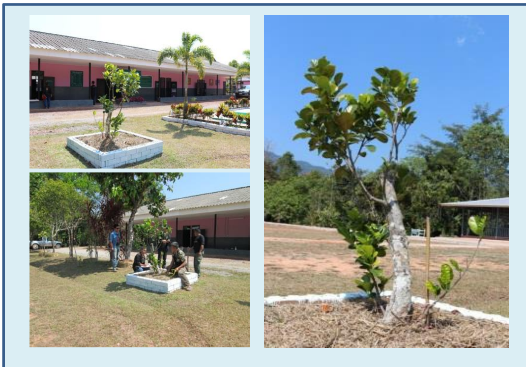
ภาพที่ ๑๕ ลำต้นและภูมิทัศน์ ต้นขนุน

สมเด็จพระเทพรัตนราชสุดาฯ สยามบรมราชกุมารี ทรงปลูก ณ โรงเรียนตำรวจตระเวนชายแดน พิระยานุเคราะห์ ๓ เฉลิมพระเกียรติ พระบาทสมเด็จพระเจ้าอยู่หัว ในวโรกาสครองราชย์ ปีที่ ๕๐ บ้านสว่าง ตำบลหนองแดง อำเภอแม่จริม จังหวัดน่าน ปลูกเมื่อ ๒๑ ตุลาคม ๒๕๔๐ ขนาดความโต ๒.๙๓ ความสูง ๑.๕๐ เมตร ทรงพุ่ม ๑.๑๐ เมตร