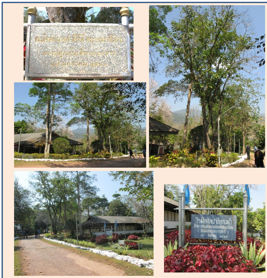
ภาพที่ ๑๔ ป้ายทรงปลูก ลำต้นและภูมิทัศน์ ต้นเสี้ยวดอกขาว

สมเด็จพระนางเจ้าสิริกิติ์ พระบรมราชินีนาถ ทรงปลูก ณ บริเวณพลับพลาทรงงาน อำเภอแม่จริม จังหวัดน่าน ปลูกเมื่อ ๑๙ มกราคม ๒๕๕๐ ขนาดความโต ๑๕.๗๔ ความสูง ๑๑.๗๐ เมตร ทรงพุ่ม ๙.๖๐ เมตร ความสูงระดับน้ำทะเล ๗๘๐ เมตร