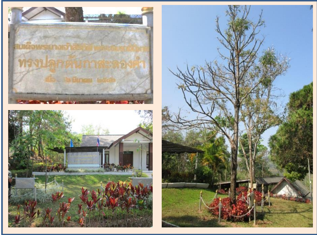
ภาพที่ ๑๑ ป้ายทรงปลูก ลำต้นและภูมิทัศน์ ต้นกาสะลองคำ

สมเด็จพระนางเจ้าสิริกิติ์ พระบรมราชินีนาถ ทรงปลูก ณ บริเวณหน้าสำนักงานบ้านน้ำตวง อำเภอแม่จริม จังหวัดน่าน ปลูกเมื่อ ๖ มีนาคม ๒๕๔๒ ขนาดความโต ๗.๓๖ ความสูง ๑๑ เมตร ทรงพุ่ม ๔.๕๐ เมตร ความสูงระดับน้ำทะเล ๗๘๓ เมตร