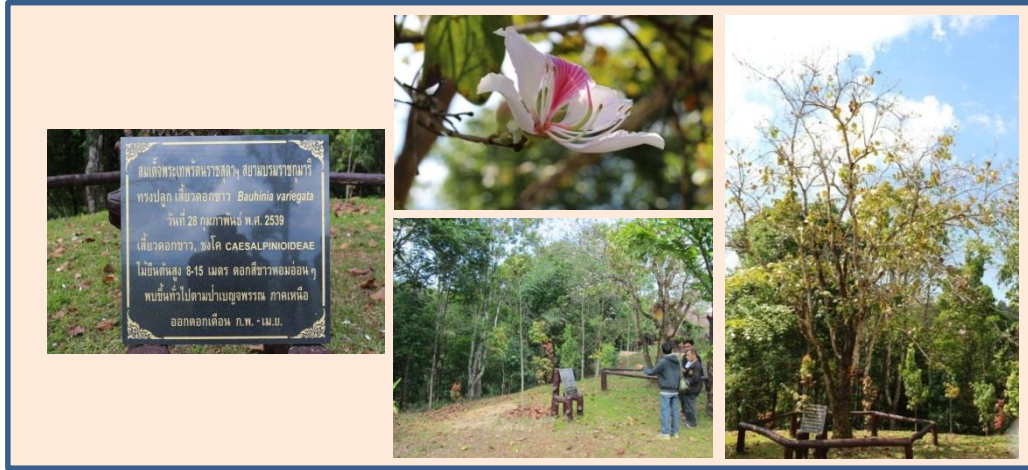
ภาพที่ ๒ ป้ายชื่อ ดอก และลำต้น ต้นเสี้ยวดอกขาว

สมเด็จพระเทพรัตนราชสุดาฯ สยามบรมราชกุมารี ทรงปลูก ณ อุทยานแห่งชาติดอยภูกาคา ปลูกเมื่อ ๒๘ กุมภาพันธ์ ๒๕๓๙ ขนาดความโต ๑๓.๑๖ ความสูง ๑๒ เมตร ทรงพุ่ม ๘ เมตร ความสูงจากระดับน้ำทะเล ๑,๒๖๗ เมตร