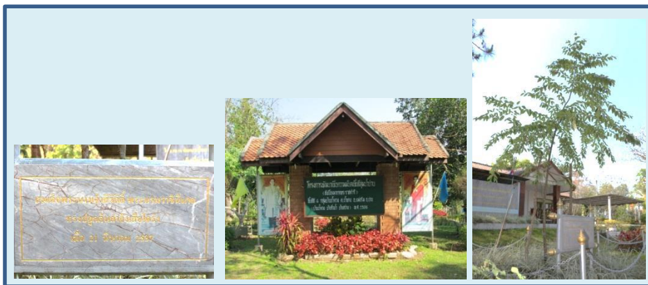
ภาพที่ ๙ ป้ายทรงปลูก ลำต้นและภูมิทัศน์ ต้นกำลังเสื่อไคร้

สมเด็จพระนางเจ้าสิริกิติ์ พระบรมราชินีนาถ ทรงปลูก ณ บริเวณหน้าสำนักงานบ้านน้ำตวง อำเภอแม่จริม จังหวัดน่าน ปลูกเมื่อ ๒๑ มีนาคม ๒๕๓๗ ขนาดความโต ๑.๑๕ ความสูง ๕.๕๐ เมตร ทรงพุ่ม ๓.๒๐ เมตร ความสูงระดับน้ำทะเล ๗๘๓ เมตร