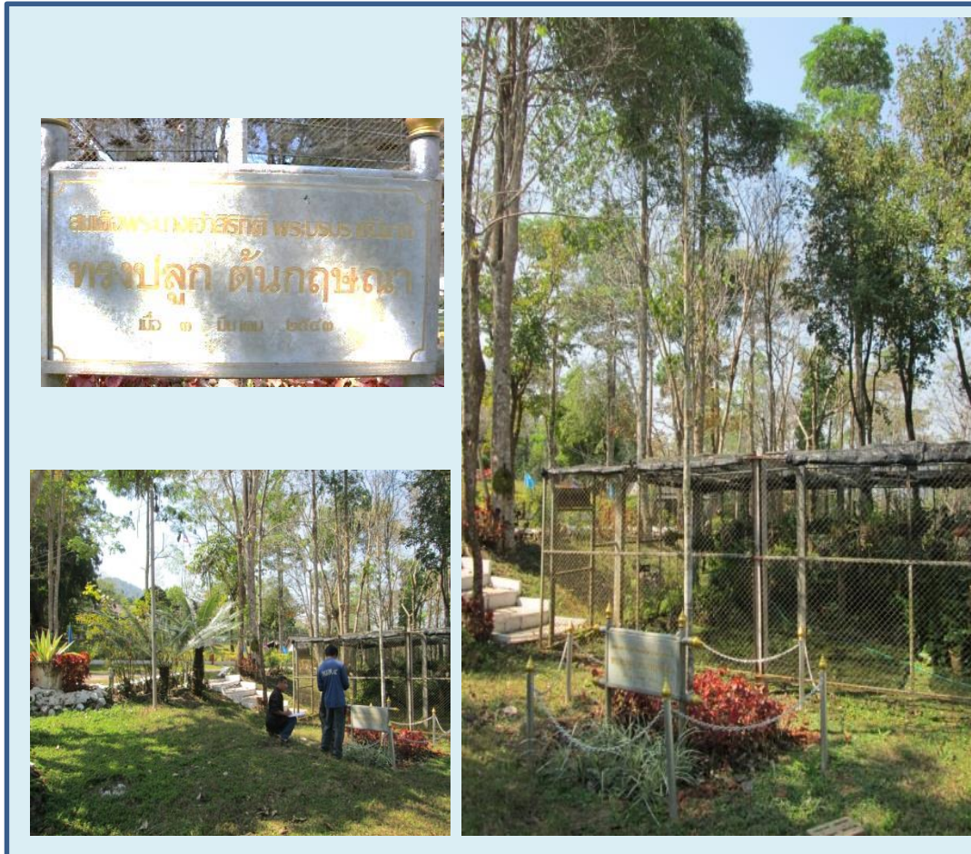
ภาพที่ ๑๓ ป้ายทรงปลูก ลำต้นและภูมิทัศน์ ต้นกฤษณา

สมเด็จพระนางเจ้าสิริกิติ์ พระบรมราชินีนาถ ทรงปลูก ณ บริเวณพลับพลาทรงงาน อำเภอแม่จริม จังหวัดน่าน ปลูกเมื่อ ๓ มีนาคม ๒๕๔๓ ขนาดความโต ๒.๖๕ ความสูง ๕ เมตร ทรงพุ่ม ๐.๕๐ เมตร ความสูงระดับน้ำทะเล ๗๘๐ เมตร