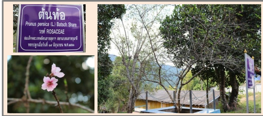
ภาพที่ ๘ ป้ายทรงปลูก ลำต้นและภูมิทัศน์ ต้นท้อ

สมเด็จพระเทพรัตนราชสุดาฯ สยามบรมราชกุมารี ทรงปลูก ณ โรงเรียนบ้านนาบง ตำบลบ่อเกลือใต้ อำเภอบ่อเกลือ จังหวัดน่าน ปลูกเมื่อ ๑๙ มิถุนายน ๒๕๔๑ ขนาดความโต ๒.๕๘ ความสูง ๓ เมตร ทรงพุ่ม ๔.๕๐ เมตร ความสูงระดับน้ำทะเล ๘๔๘ เมตร