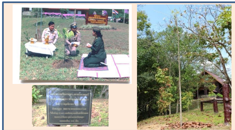
ภาพที่ ๓ ภาพขณะทรงปลูก ป้ายชื่อ และต้นชมพูภูคา

สมเด็จพระเทพรัตนราชสุดาฯ สยามบรมราชกุมารี ทรงปลูก ณ อุทยานแห่งชาติดอยภูกาคา ปลูกเมื่อ ๒๘ กุมภาพันธ์ ๒๕๓๙ ขนาดความโต ๑.๔๗ ความสูง ๓.๘๐ เมตร ความสูงจากระดับน้ำทะเล ๑,๒๖๗ เมตร